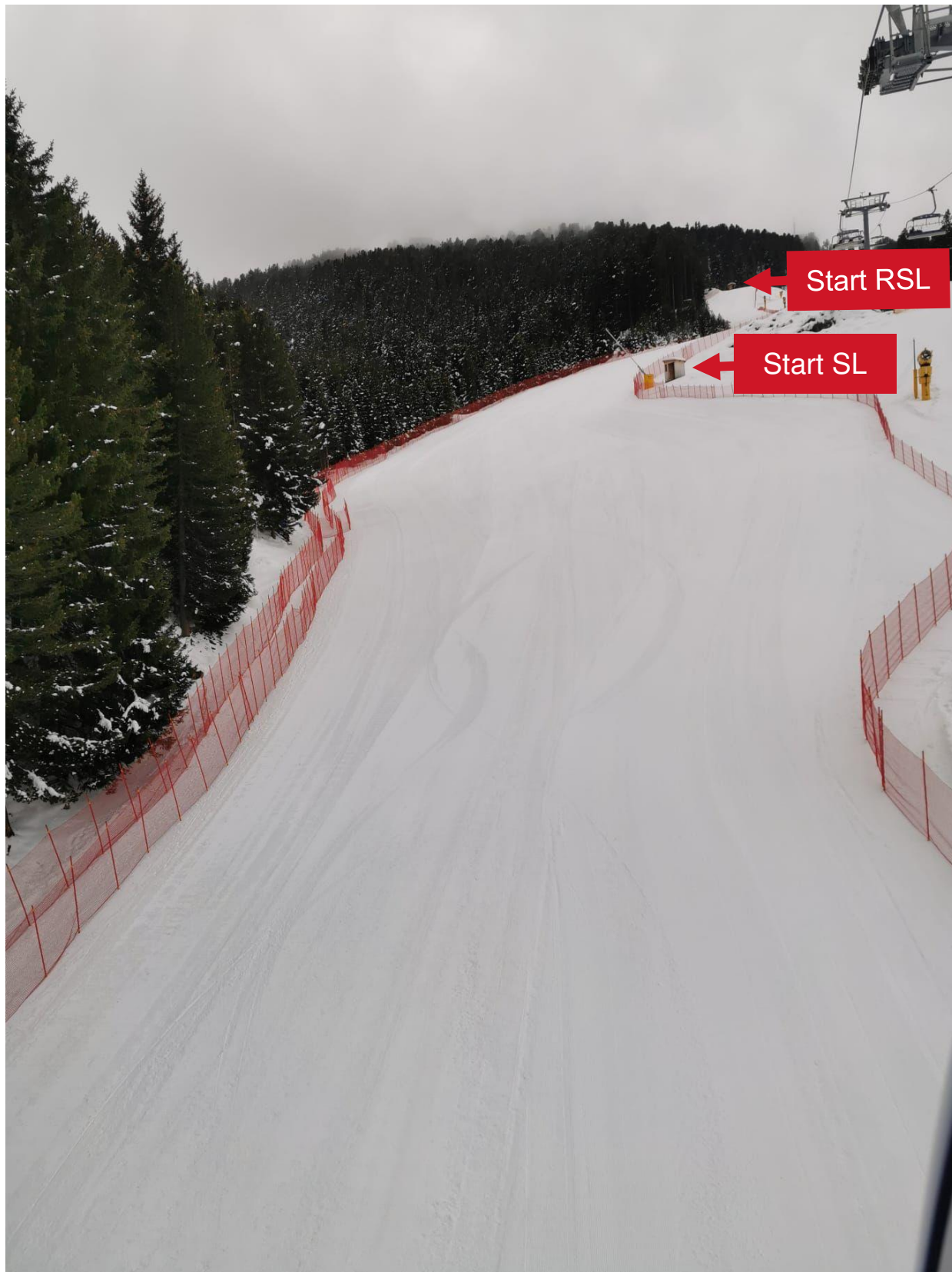
Rennstrecke – Oberer Teil