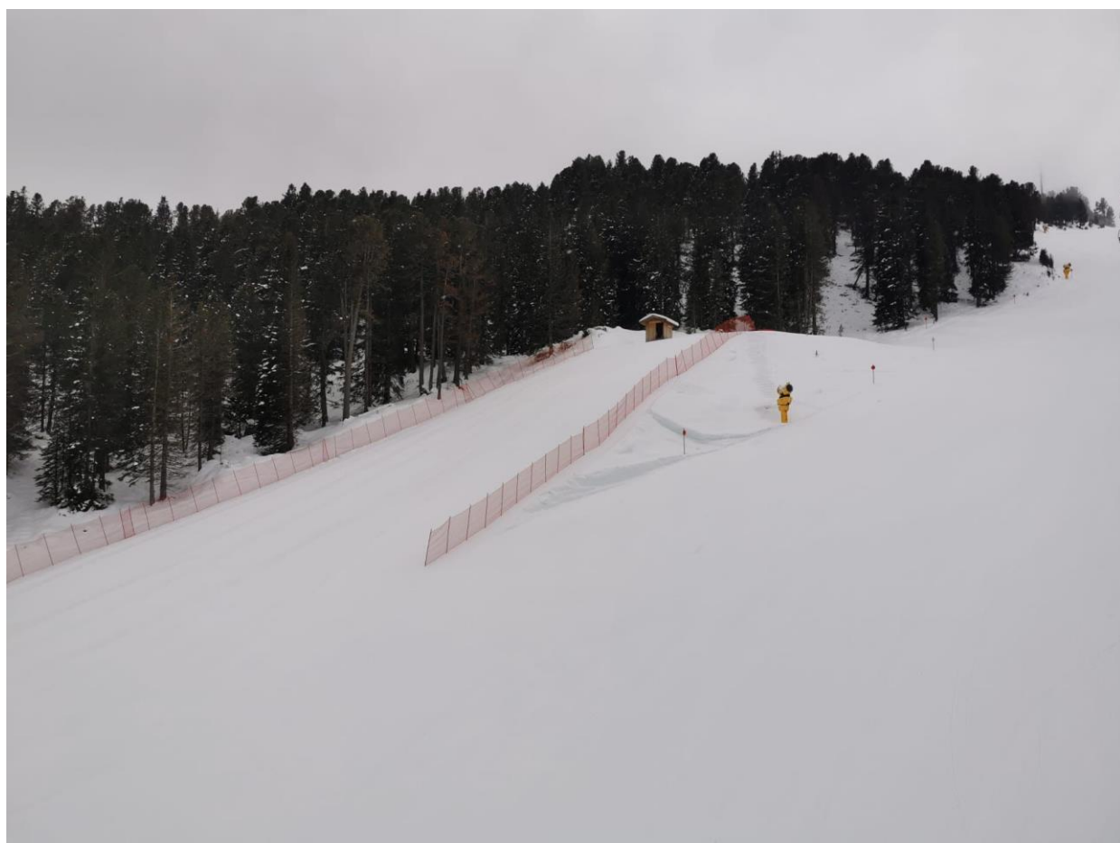
Rennstrecke – Start RSL