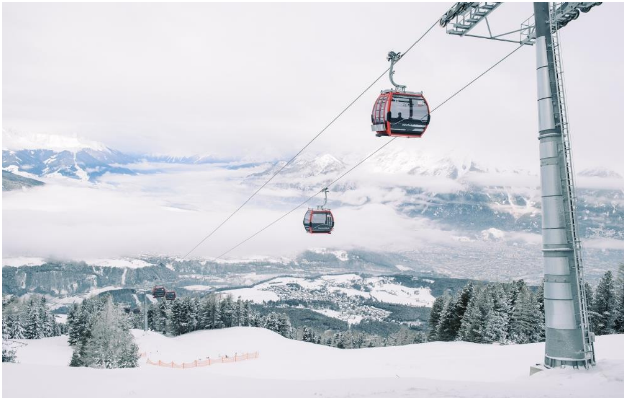
Abbildung 2: Große 10er Gondel erleichtert Skibob Transport im zusammengebauten Zustand